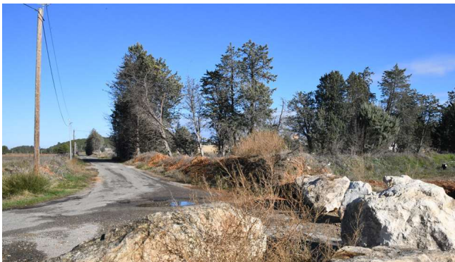
La voie actuelle va être déplacée

Il semble important de mobiliser les collectivités locales et les différents partenaires pour l'élaboration d'un