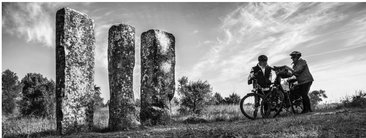
Bornes des César à la sortie de Beaucaire

Ce site est actuellement le seul exemple de quatre bornes "in situ"