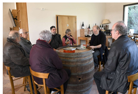
Echange au Mas des Tourelles pour évoquer le potentiel du territoire