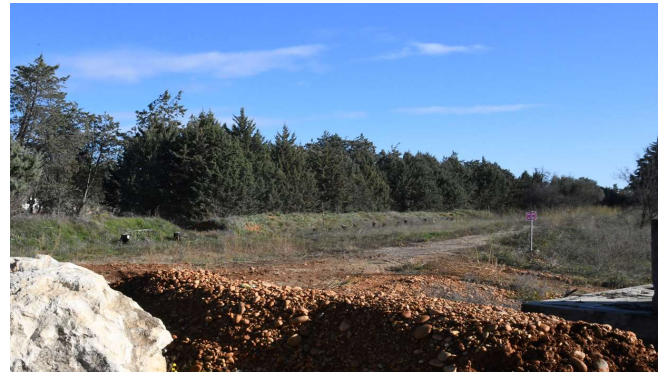
Voie d'accès vers les colonnes de César