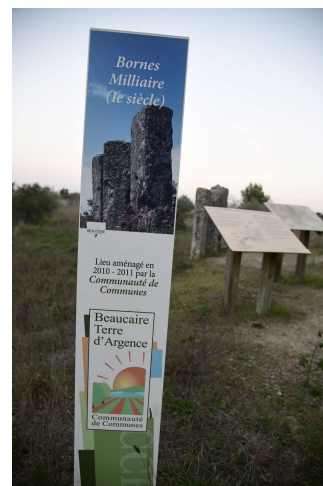
Panneaux installés en 2010