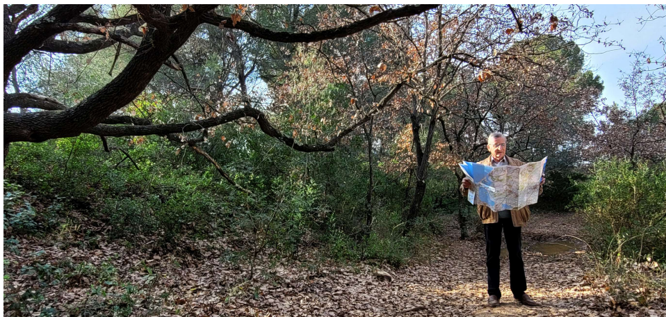
Philippe Auriol du Parc Culturel du Biterrois assure les relevés sur le biterrois