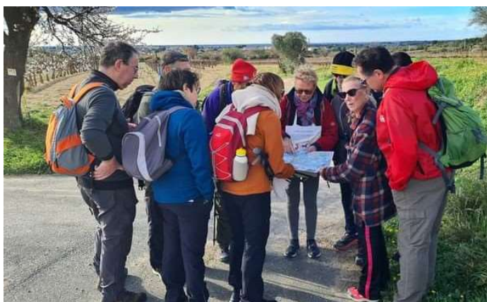
Chaque mois des balades découverte entre Méze et Pinet (34) sont organisées par l'Association "Si la via m'était contée" Contact tel : 06 83 26 21 78

Au cours des prochains mois des animations sont déjà programmées :