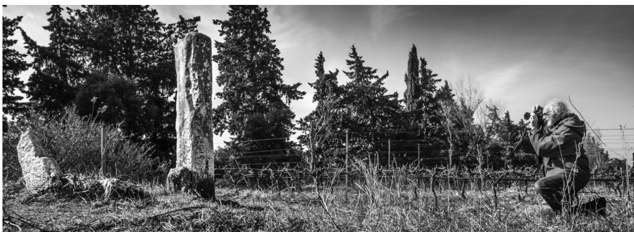
la "Peire di Novi" (la pierre des fiancés) l'original "in situ" du Milliaire IX, dédié à Tibère située à Jonquières.

Le collectif Via-Domitia Occitanie est un réseau d'acteurs ayant pour objectif de faire découvrir ce vestige du patrimoine romain, véritable lien entre les grands sites d'Occitanie.