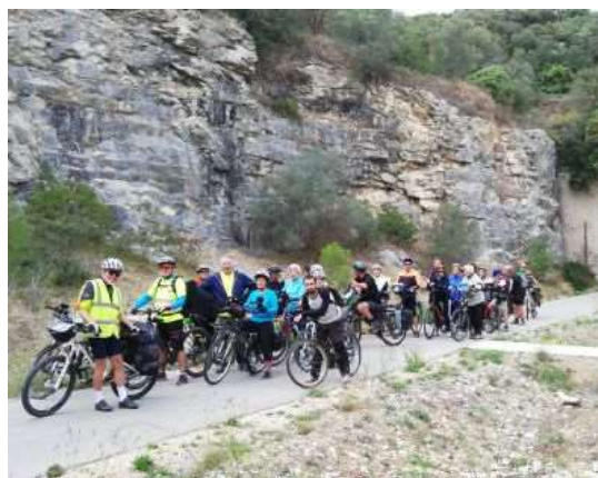
Le 21 mai : Mai à vélo de Beaucaire à Nîmes organisée par Gard O vélo. Contact tel : 06 30 00 96 75