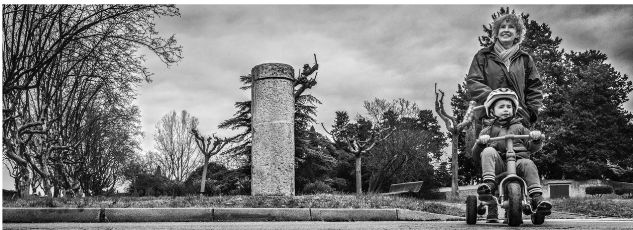
Borne milliaire à Bernis -Gard-