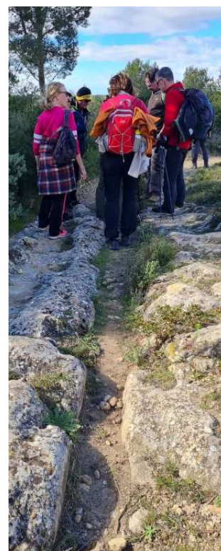
Balade découverte secteur de Pinet organisée par l'Association "Si la via domitia m'était contée"