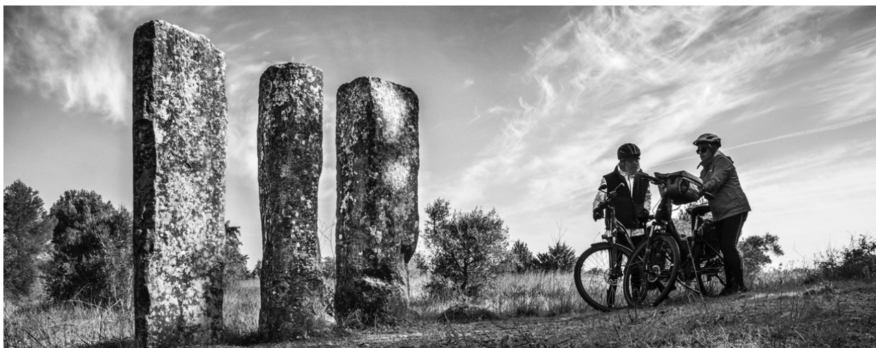
Bornes de César à la sortie de Beaucaire

Rendre accessible la voie depuis Beaucaire jusqu'aux Pyrénées.