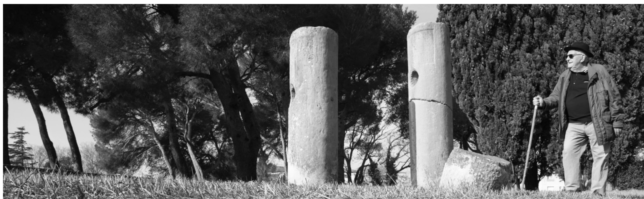
Bornes milliaires de Claude Les cinq Coins Beaucaire.