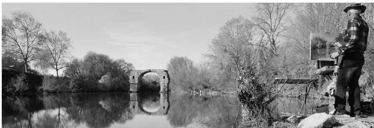
Pont Ambroix Ambrussum.

Faire émerger un projet à portée régionale