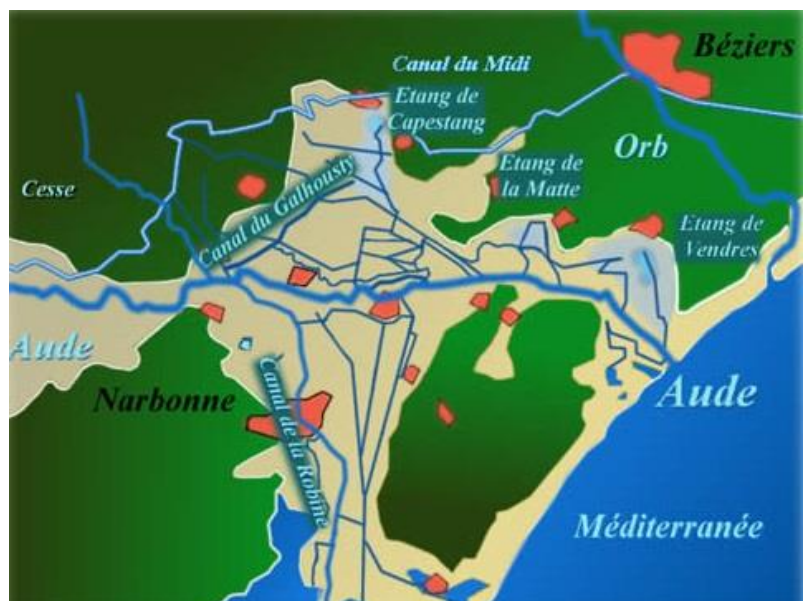
Le réseau hydrographique du delta de l'Aude

Dans la période récente, pendant la transgression flandrienne à la fin de la glaciation de Würm (-15.000), par suite de la fonte des calottes glaciaires, la mer monte jusqu'à un maximum de +10m autour de -2.500 ans. Juste avant notre ère, l'étang est alors l'extrémité d'un golfe marin ouvert sur la mer Méditerranée, à côté du delta de l'Aude, qui se jette dans la mer au sud de Narbonne.